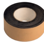
4 Cembrit blivēšanas lentas